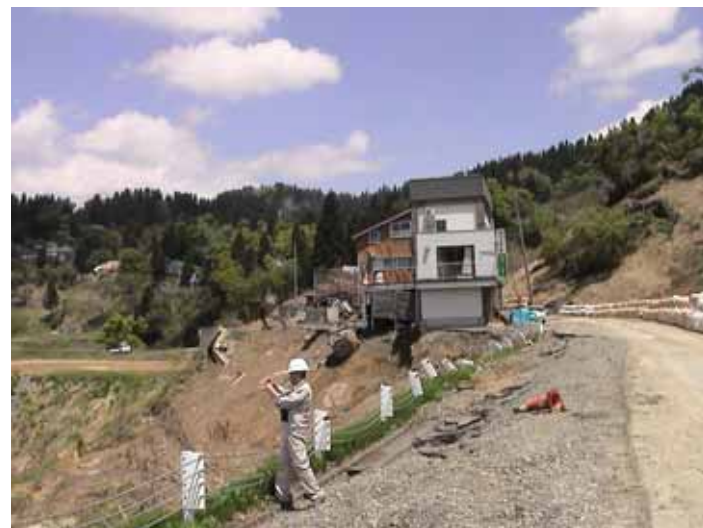
31-14竹沢DSC00157.JPG 2005/05/14 11:58:17 盛土部の崩落