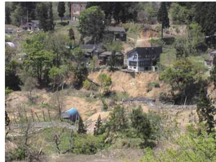
31-23竹沢地すべりDSC00175.JPG 2005/05/14 12:01:29