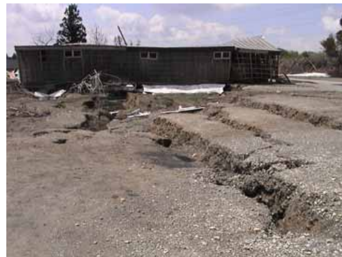
25-01榎木南平DSC00002.JPG 2005/05/14 10:11:34 崖地上の地盤にはクラックが多数発達