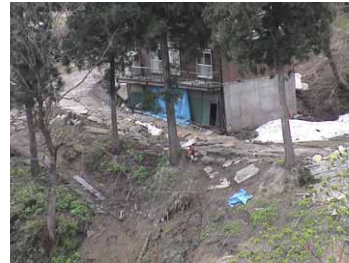
30-05大久保DSC00113.JPG 2005/05/14 11:18:43