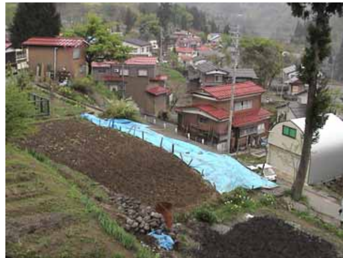
52-04蓬平集落DSC00070.JPG 2005/05/15 10:24:51