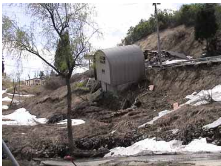
23-08池谷DSC00085.JPG 2005/05/14 11:08:04