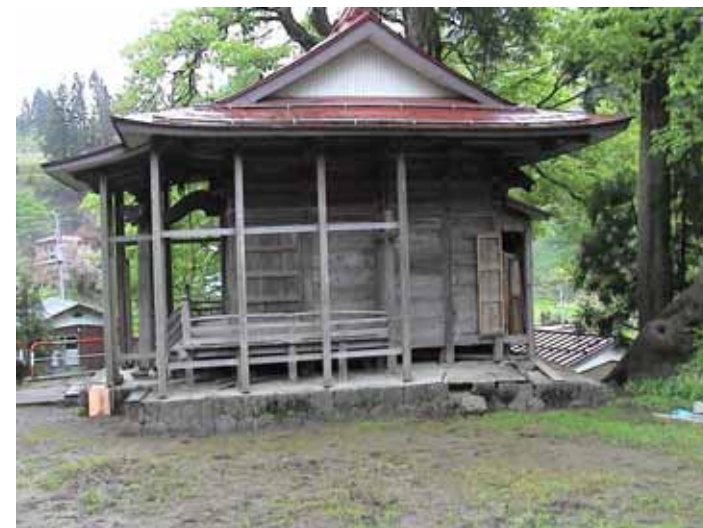
55-03濁沢DSC00112.JPG 2005/05/15 10:55:42