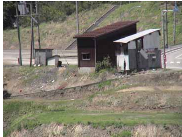
31-10竹沢DSC00149.JPG 2005/05/14 11:52:39