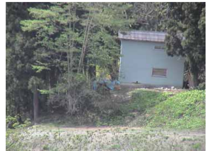
34-03竹沢DSC00198.JPG 2005/05/14 12:56:38