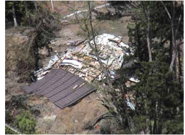
31-20竹沢DSC00164.JPG 2005/05/14 11:59:05