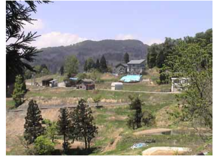
31-08竹沢DSC00147.JPG 2005/05/14 11:52:23