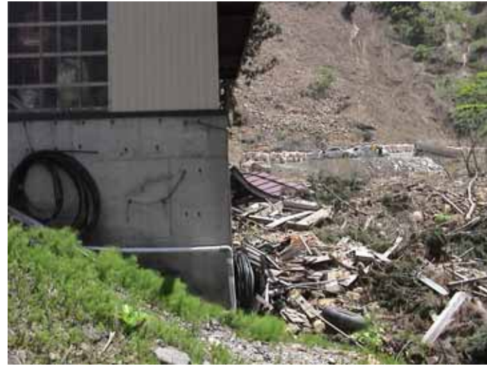
31-06竹沢DSC00143.JPG 2005/05/14 11:51:25 外見上変状無し