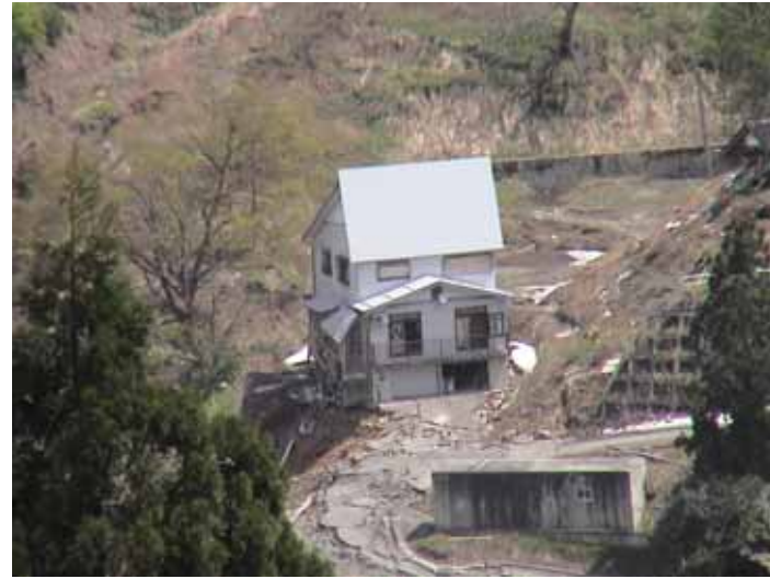
25-12 榑木DSC00031.JPG 2005/05/14 10:23:03