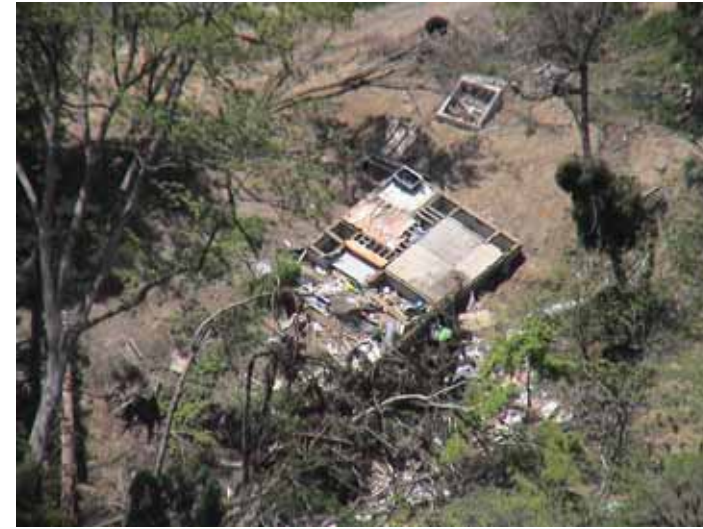
31-19竹沢DSC00163.JPG 2005/05/14 11:58:57