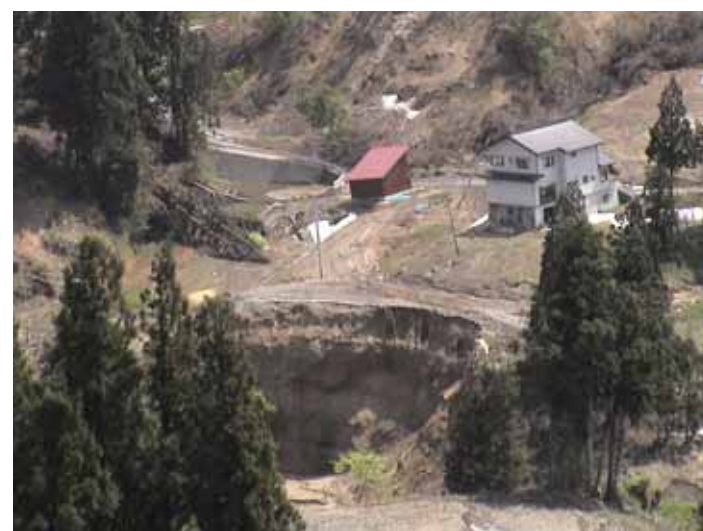
25-05榎木DSC00019.JPG 2005/05/14 10:19:52