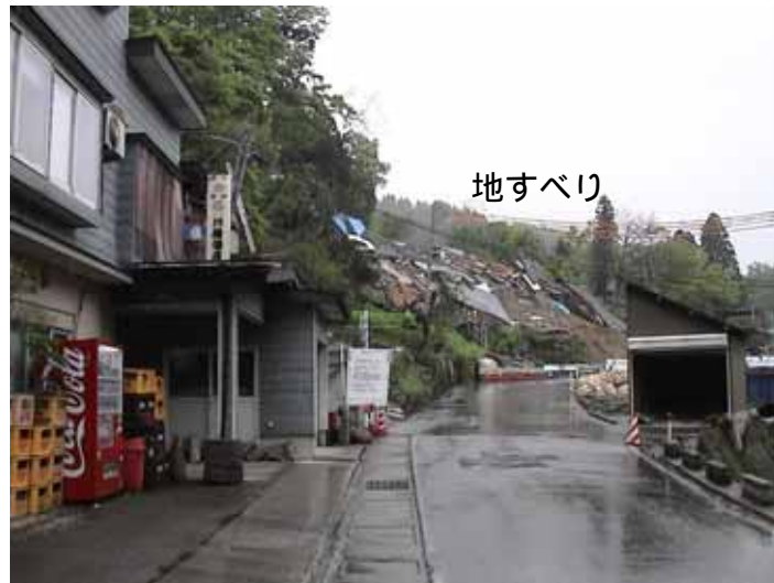
55-05濁沢2名死亡地すべりDSC00122.JPG 2005/05/15 11:01:02