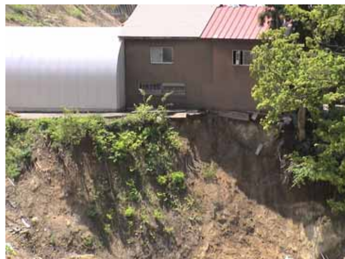
31-02竹沢DSC00132.JPG 2005/05/14 11:47:12