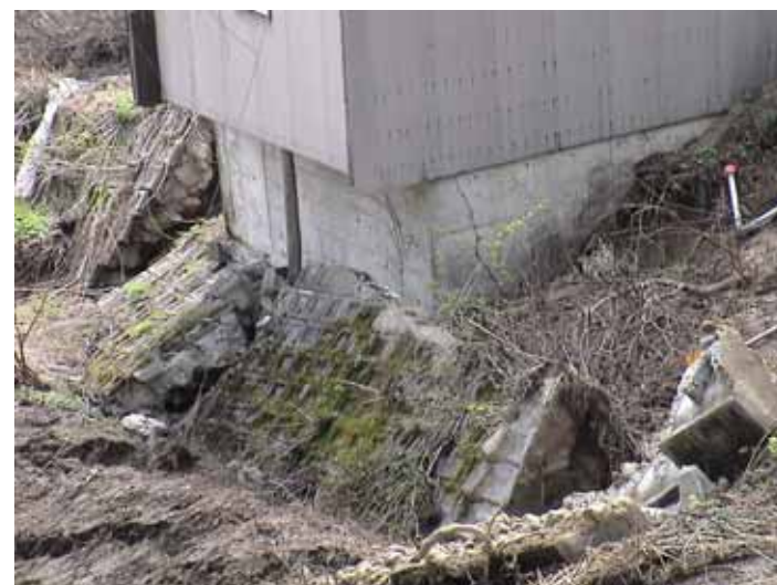
23-09池谷DSC00086.JPG 2005/05/14 11:08:11 ブロック積擁壁の盛土部崩壊