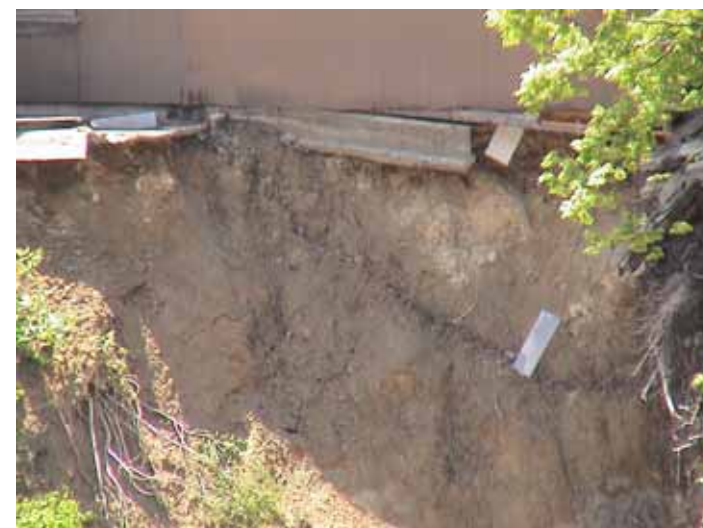
31-03竹沢DSC00133.JPG 2005/05/14 11:47:20