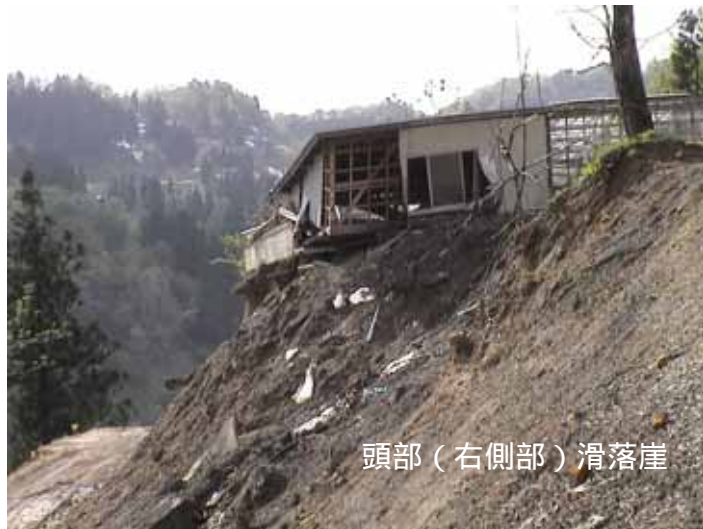
12-04寺野DSC00195.JPG 2005/05/13 15:13:03