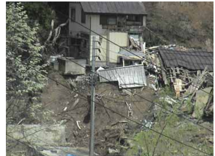
23-02池谷DSC00074.JPG 2005/05/14 11:02:26 盛土部の崩壊