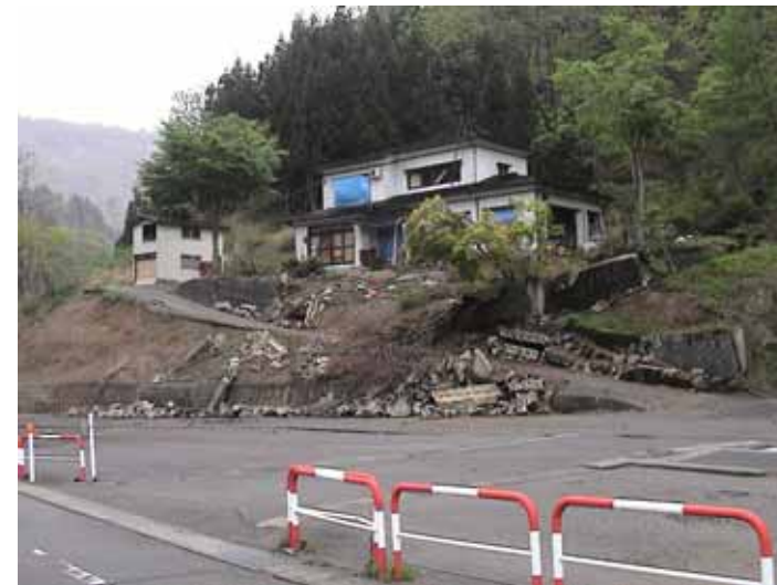
53-01太田川DSC00072.JPG 2005/05/15 10:30:01 盛土地盤が変形