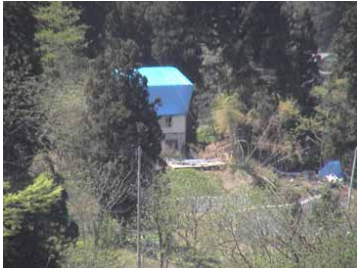
34-04竹沢DSC00199.JPG 2005/05/14 12:57:40