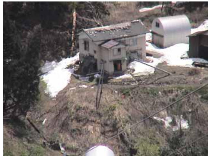
25-16 榑木DSC00066.JPG 2005/05/14 10:59:07