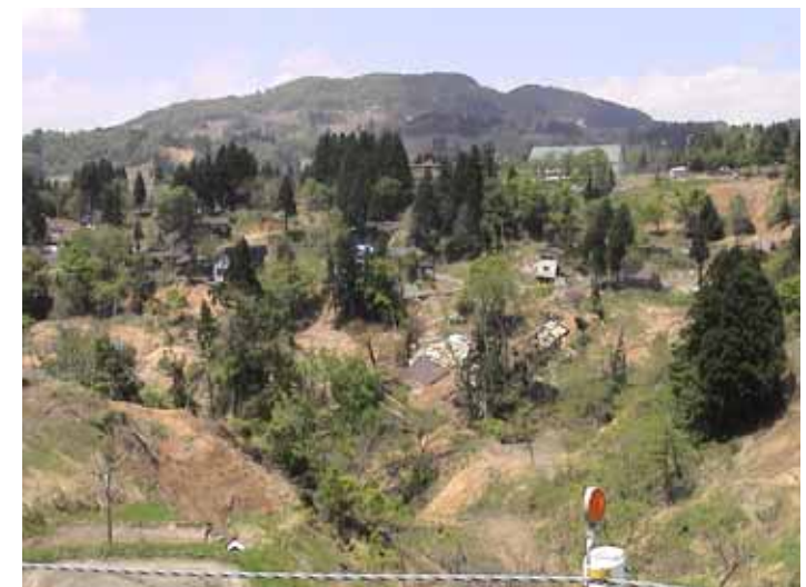
31-16竹沢DSC00160.JPG 2005/05/14 11:58:39