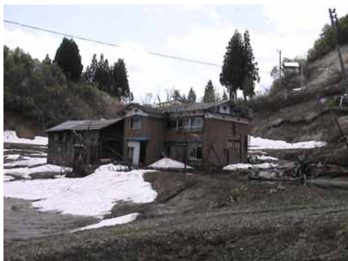
23-12池谷DSC00093.JPG 2005/05/14 11:09:25 水田と同じ地盤上の家屋（外見上ひどく変形していない）