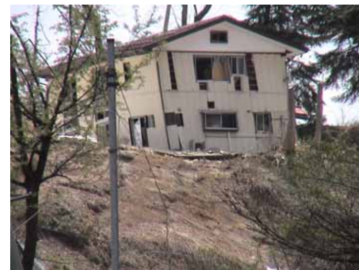
23-10池谷DSC00089.JPG 2005/05/14 11:08:34