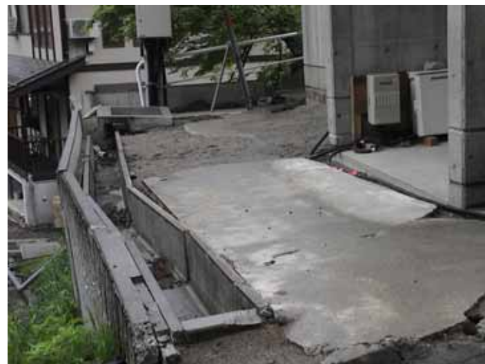
55-02濁沢ポンプ室DSC00110.JPG 2005/05/15 10:53:42 盛土地盤が変形