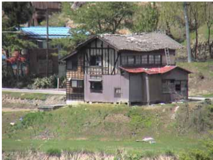
31-09竹沢DSC00148.JPG 2005/05/14 11:52:31