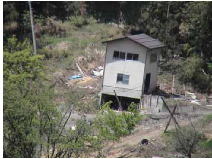
31-18竹沢DSC00162.JPG 2005/05/14 11:58:53