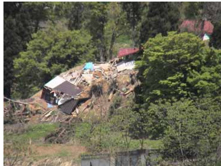
31-22竹沢DSC00173.JPG 2005/05/14 12:01:12