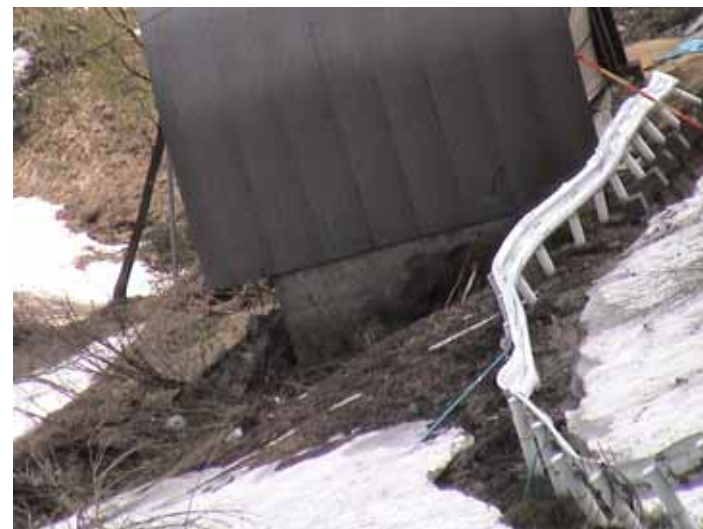
23-05池谷DSC00077.JPG 2005/05/14 11:04:50