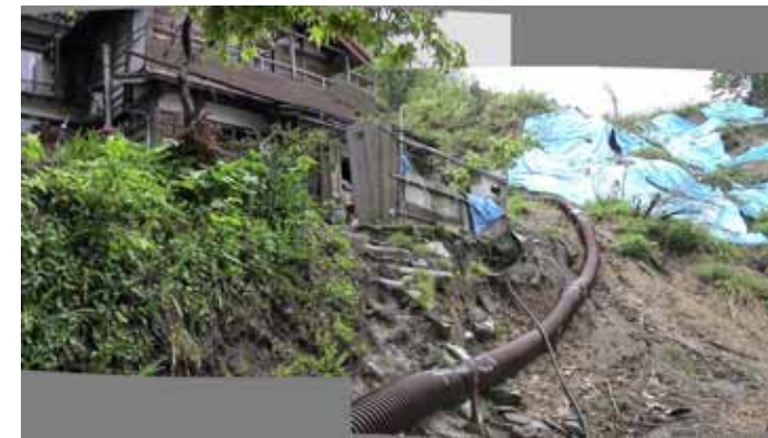
55-07濁沢右側部上家屋.JPG

写真の撮影は、変状が著しい家屋・宅地だけでなく、外見上変状がほとんど見当たらないものも対象にしています。 地すべりが発生しそれに巻き込まれている箇所を除けば、変状のある箇所の大半は盛土部か、急崖部に位置しています。