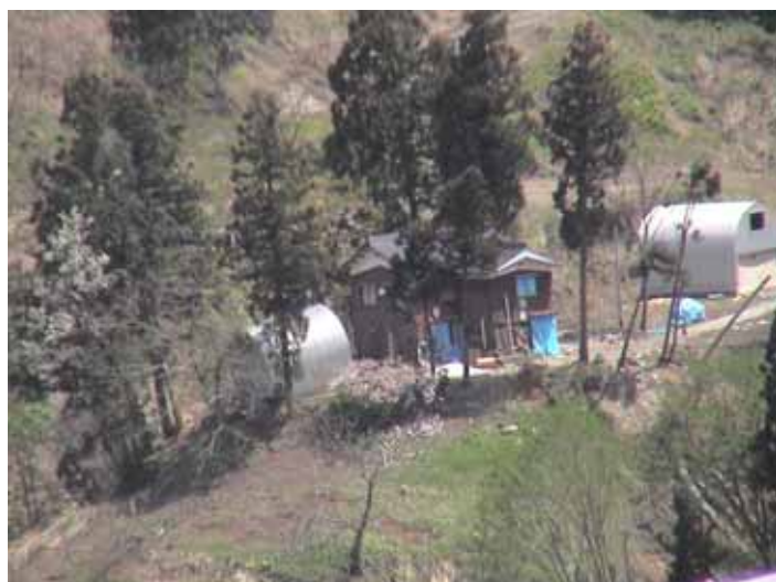
25-08榎木DSC00016.JPG 2005/05/14 10:19:20