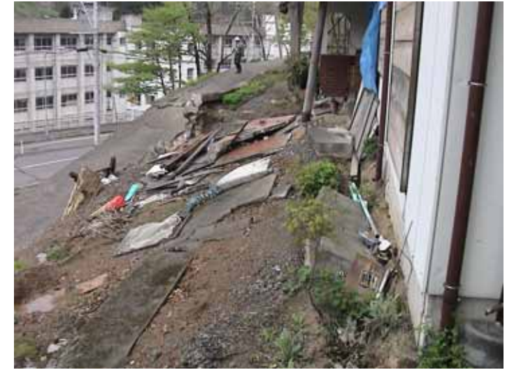
52-03太田川DSC00099.JPG 2005/05/15 10:35:47