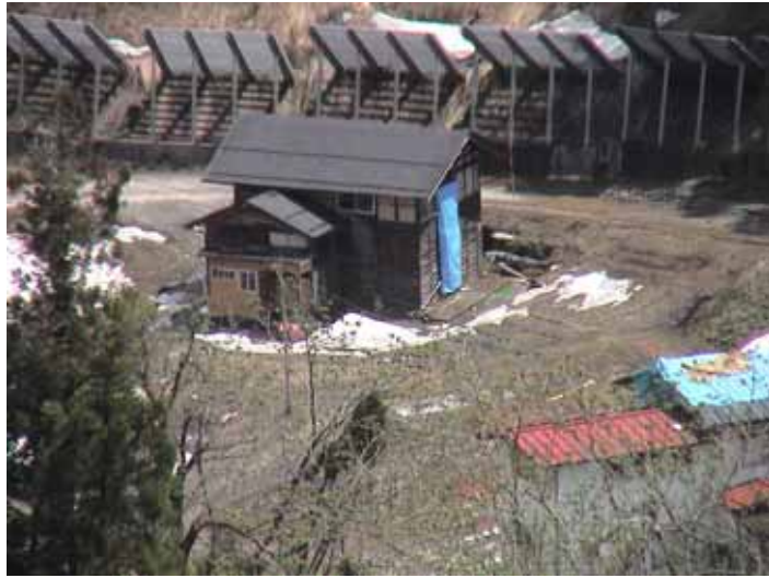
25-11 榑木DSC00030.JPG 2005/05/14 10:22:56