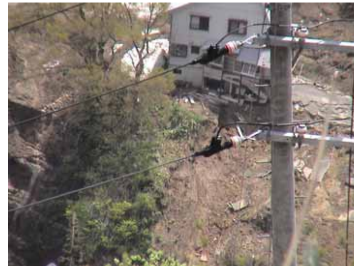
25-17 榑木DSC00067.JPG 2005/05/14 10:59:46