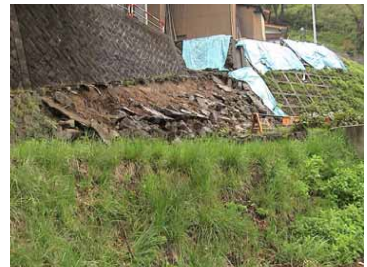
55-04濁沢空石積DSC00119.JPG 2005/05/15 10:58:50