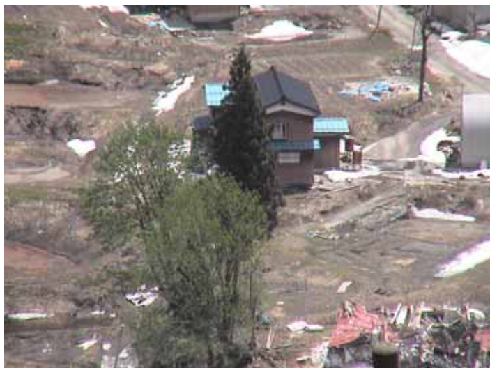
25-19 榑木DSC00069.JPG 2005/05/14 10:59:56