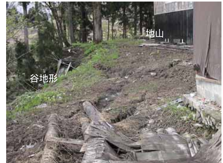
12-06寺野谷地形部DSC00207.JPG 2005/05/13 15:18:56