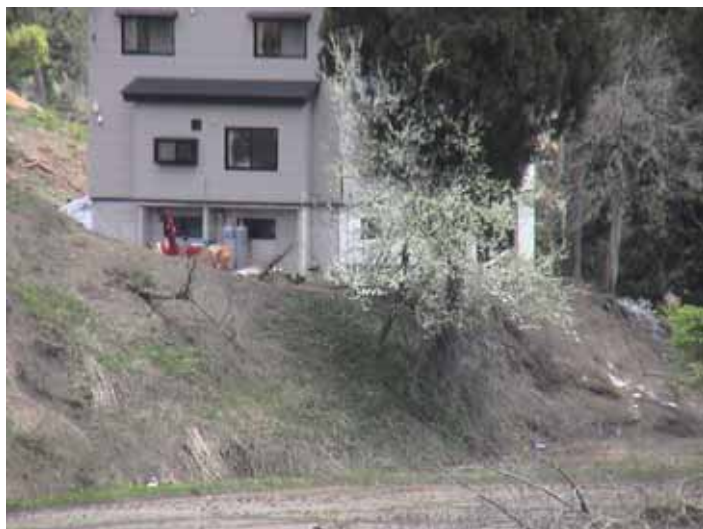
23-15池谷DSC00098.JPG 2005/05/14 11:10:46