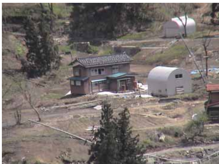
25-07榎木DSC00015.JPG 2005/05/14 10:19:13