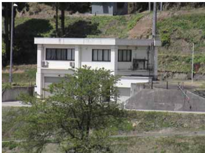
31-13竹沢DSC00154.JPG 2005/05/14 11:54:11