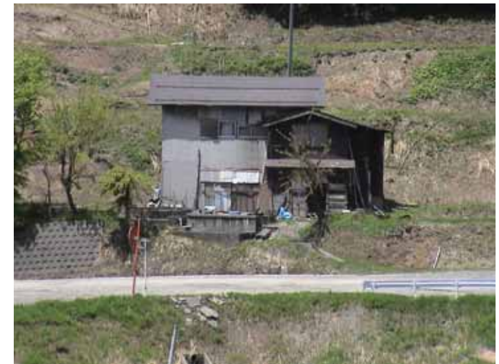
31-12竹沢DSC00153.JPG 2005/05/14 11:54:06