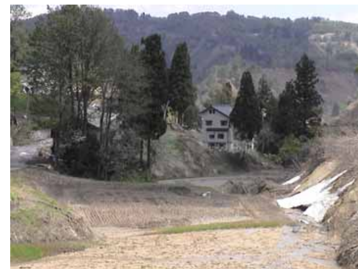
23-14池谷DSC00097.JPG 2005/05/14 11:10:41 外見上変形していない