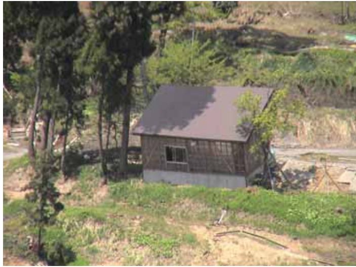
31-17竹沢DSC00161.JPG 2005/05/14 11:58:48