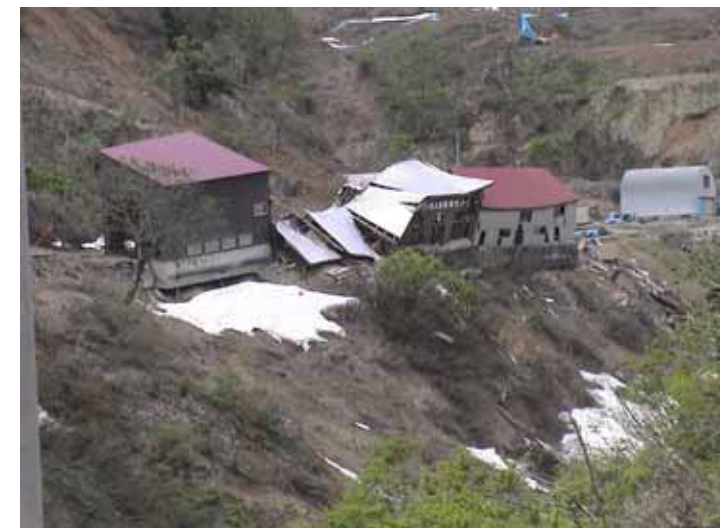
30-01 大久保DSC00107.JPG 2005/05/14 11:17:17 急崖部地盤が変形