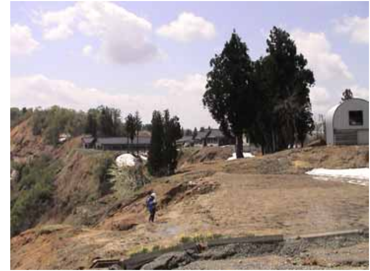
25-14 南平DSC00033.JPG 2005/05/14 10:25:54