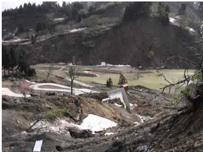
12-07ポンプ場倒壊DSC00208.JPG 2005/05/13 15:21:35