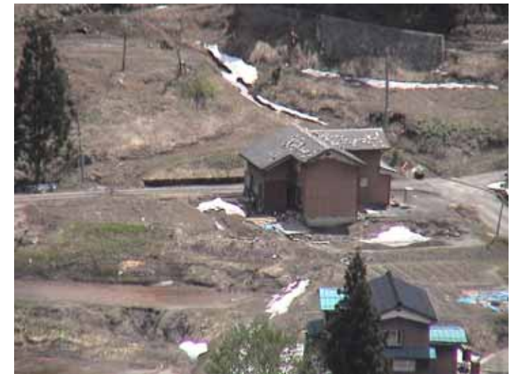
25-18 榑木DSC00068.JPG 2005/05/14 10:59:51