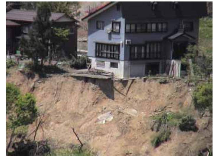
31-24竹沢地すべりDSC00176.JPG 2005/05/14 12:01:36 地すべりの頭部滑落崖