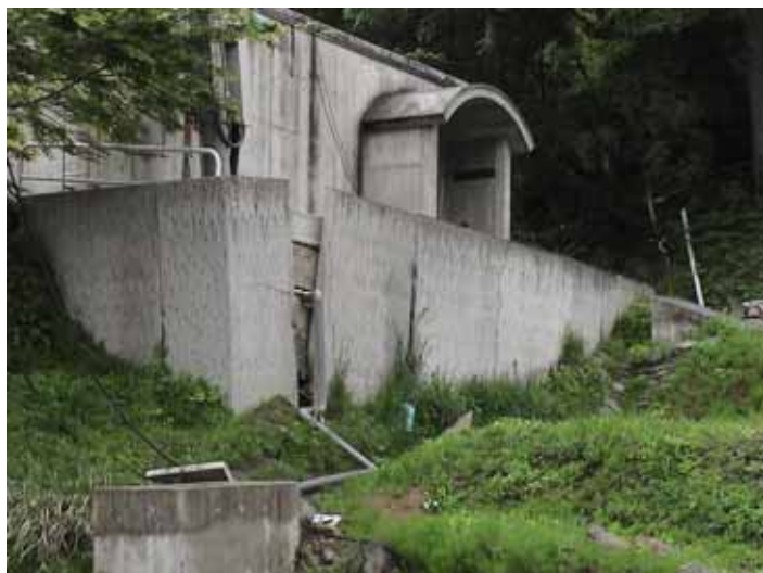
55-01濁沢ポンプ室DSC00108.JPG 2005/05/15 10:53:01