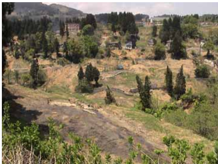
31-25竹沢地すべりDSC00182.JPG 2005/05/14 12:06:42