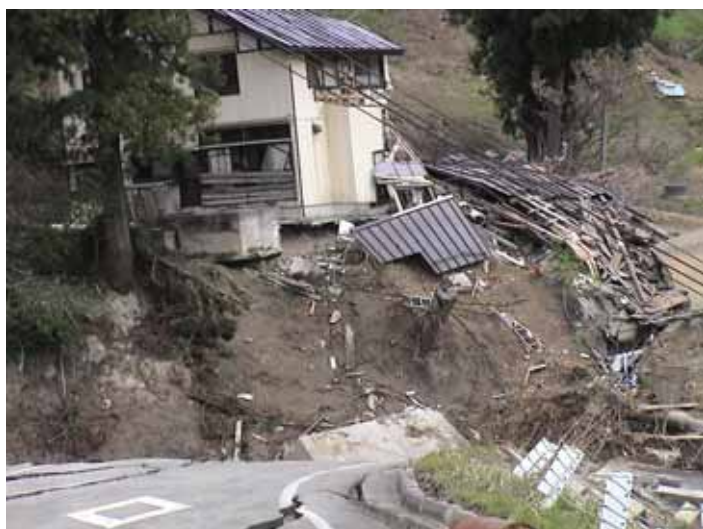
23-07池谷DSC00082.JPG 2005/05/14 11:06:40