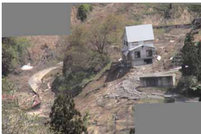
25-03榎木宅地Stitched_Result.JPG 急崖部の地盤が崩落