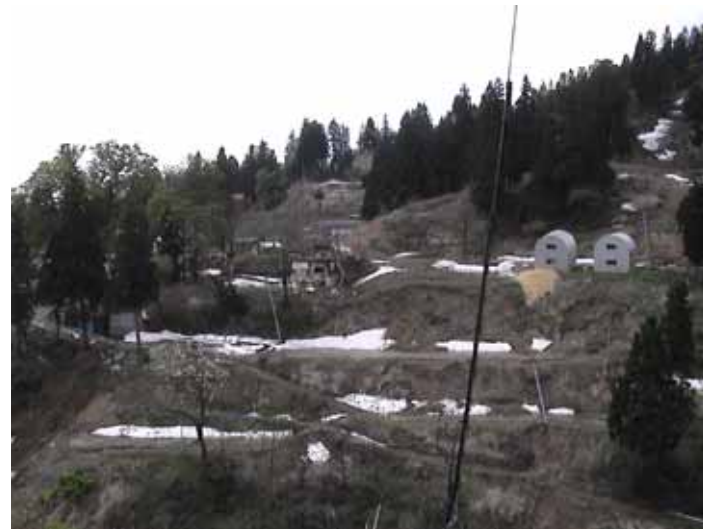
30-03大久保DSC00110.JPG 2005/05/14 11:18:24