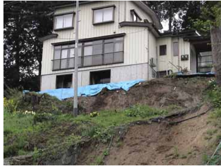
52-01蓬平DSC00059.JPG 2005/05/15 10:19:21 この家は地すべりの外側にある