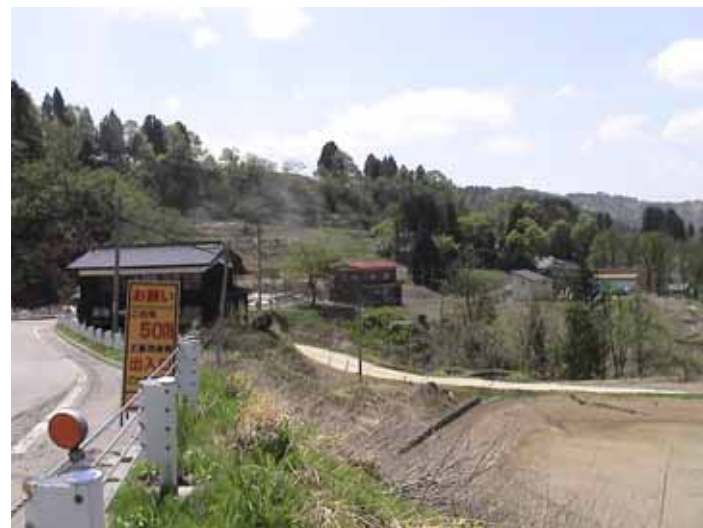
34-01竹沢DSC00194.JPG 2005/05/14 12:55:48