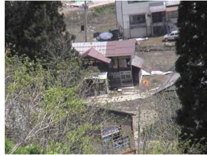
25-13 榑木DSC00032.JPG 2005/05/14 10:23:27