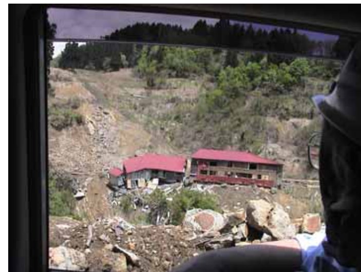
30-08大久保DSC00125.JPG 2005/05/14 11:42:49