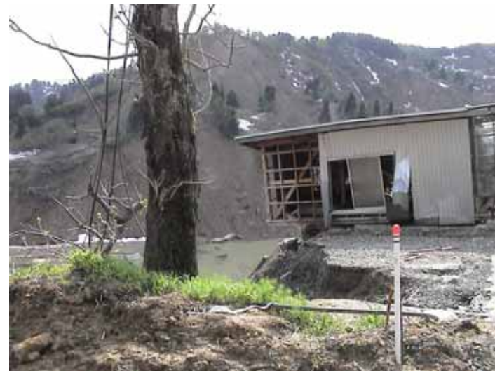
12-05寺野DSC00198.JPG 2005/05/13 15:14:09