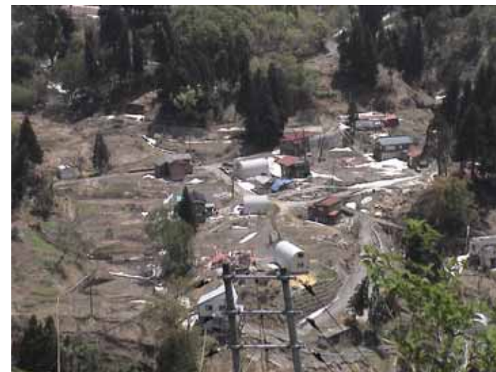
25-21 榑木DSC00072.JPG 2005/05/14 11:00:13