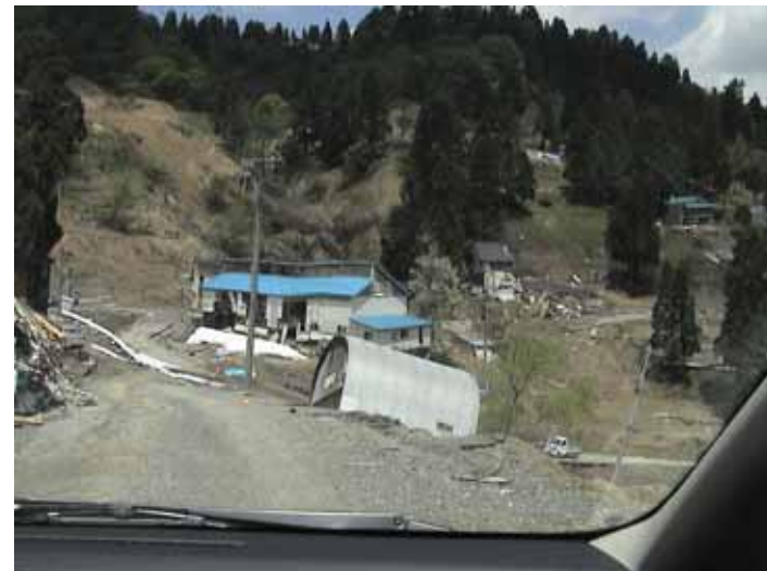
23-01池谷DSC00073.JPG 2005/05/14 11:02:21