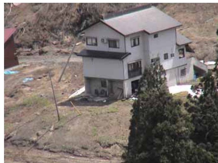
25-09榎木DSC00020.JPG 2005/05/14 10:20:00