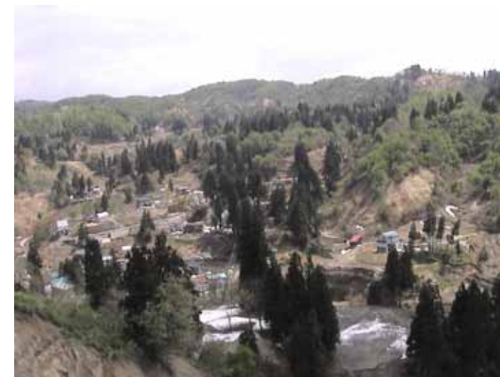
25-02榎木集落DSC00007.JPG 2005/05/14 10:13:37