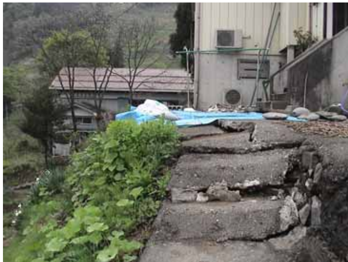
52-03蓬平DSC00067.JPG 2005/05/15 10:23:30