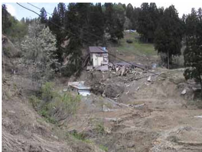
23-11池谷DSC00090.JPG 2005/05/14 11:08:52