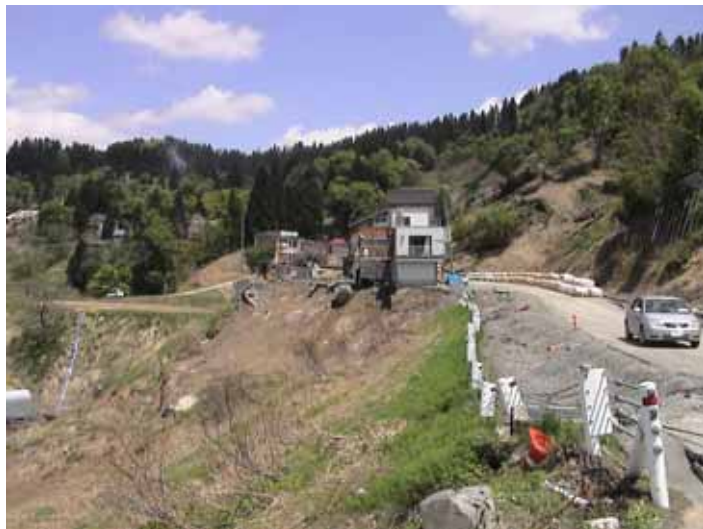
31-21竹沢DSC00171.JPG 2005/05/14 12:00:53