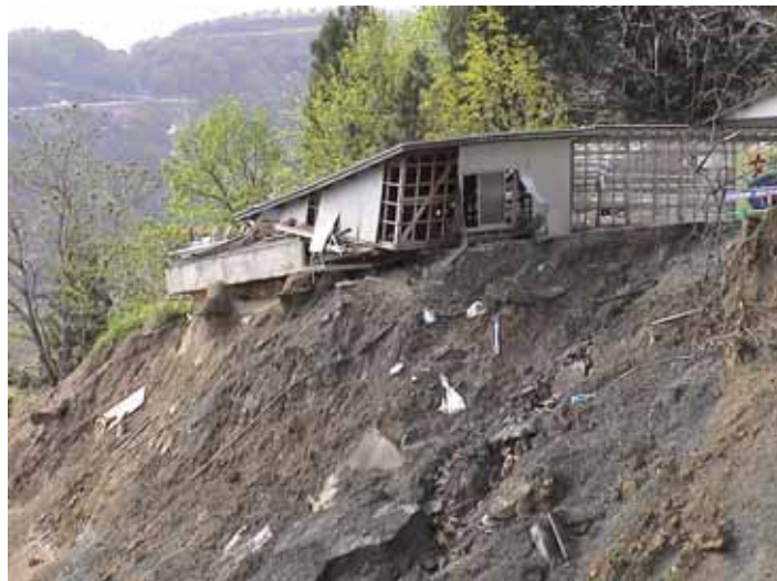
12-08寺野右側部DSC00210.JPG 2005/05/13 15:25:03