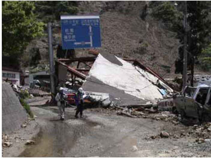
31-05竹沢DSC00142.JPG 2005/05/14 11:50:56