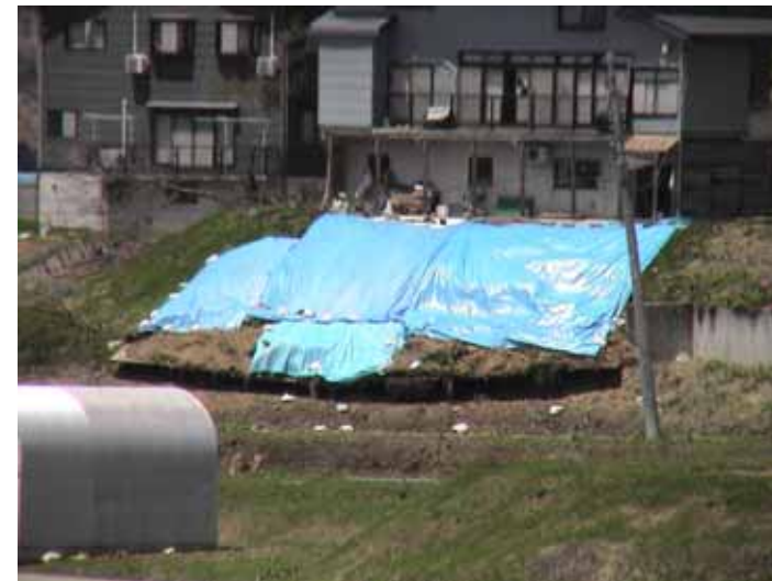
31-11竹沢DSC00151.JPG 2005/05/14 11:52:52