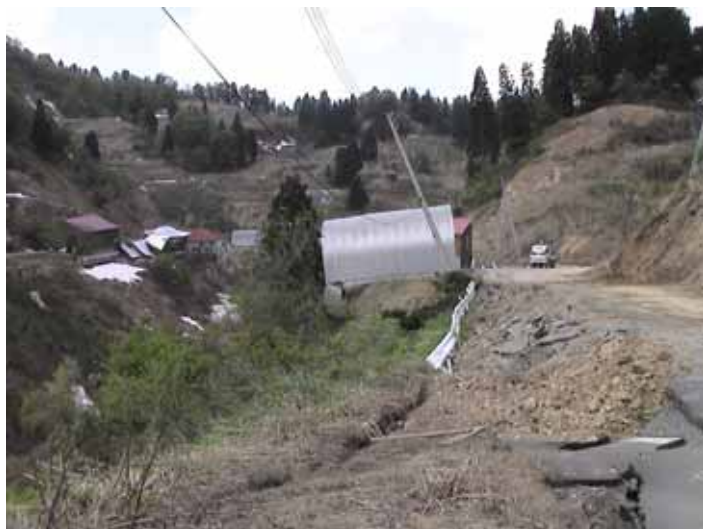
30-06大久保DSC00115.JPG 2005/05/14 11:19:22