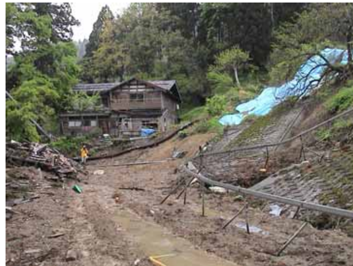
55-06濁沢2名死亡頭部DSC00158.JPG 2005/05/15 11:18:28