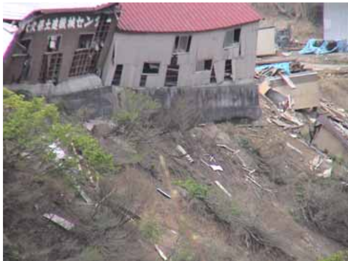
30-02大久保DSC00108.JPG 2005/05/14 11:17:21