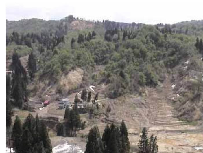
25-10榎木土石流堆積物上SC00027.JPG 2005/05/14 10:21:42