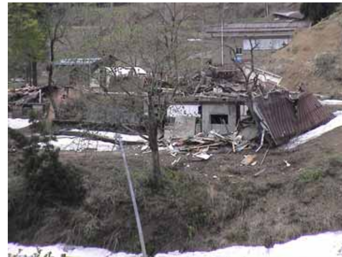
30-04大久保DSC00111.JPG 2005/05/14 11:18:31