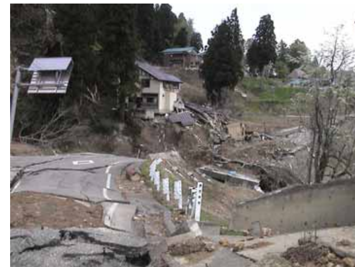
23-06池谷DSC00079.JPG 2005/05/14 11:06:09