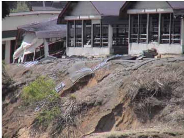
25-15 南平DSC00035.JPG 2005/05/14 10:26:12