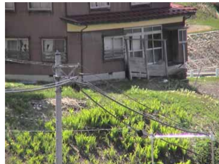
34-02竹沢DSC00195.JPG 2005/05/14 12:55:55