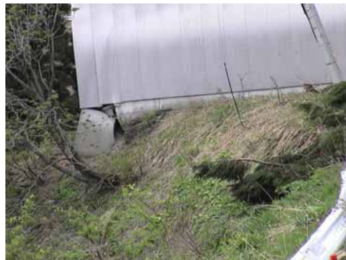
30-07大久保DSC00116.JPG 2005/05/14 11:19:28