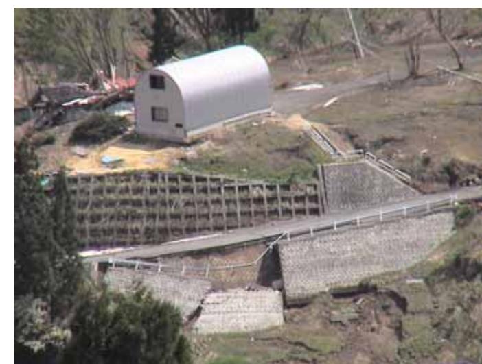
25-06榎木DSC00014.JPG 2005/05/14 10:19:08