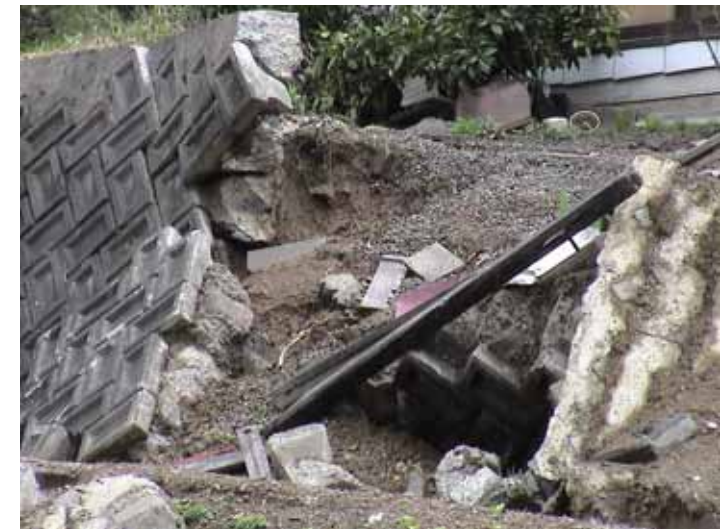
53-02太田川DSC00078.JPG 2005/05/15 10:31:04