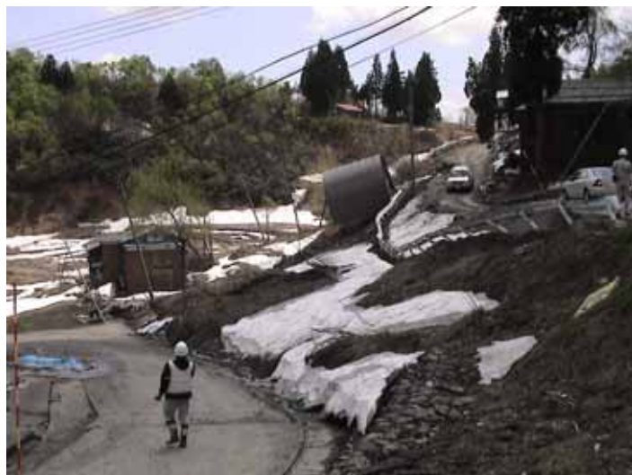
23-04池谷DSC00076.JPG 2005/05/14 11:04:42