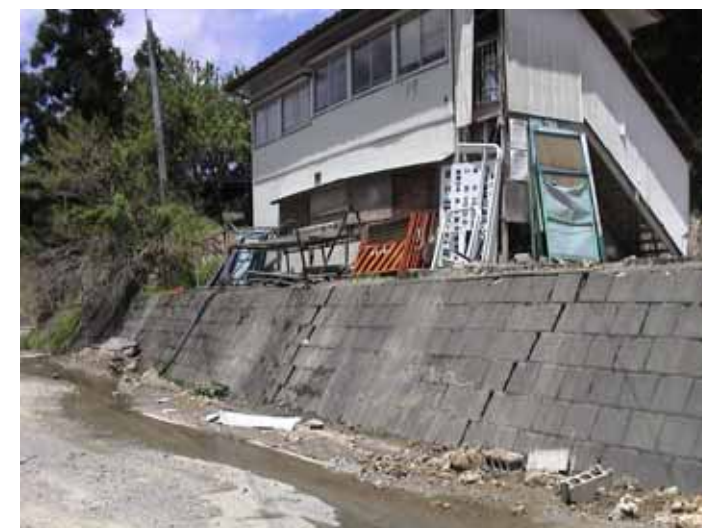
31-04竹沢DSC00140.JPG 2005/05/14 11:50:31