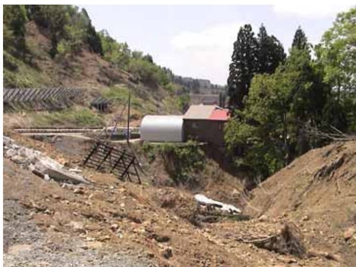
31-01竹沢DSC00130.JPG 2005/05/14 11:46:56