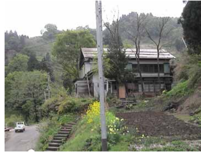
52-02蓬平DSC00064.JPG 2005/05/15 10:21:23