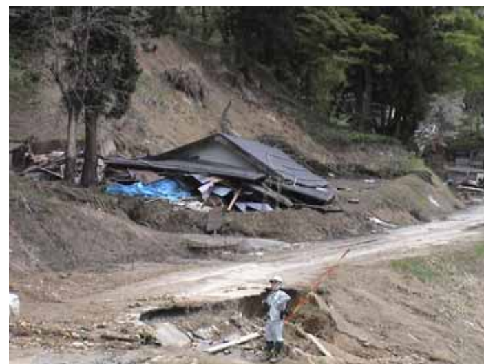
23-13池谷DSC00096.JPG 2005/05/14 11:09:58