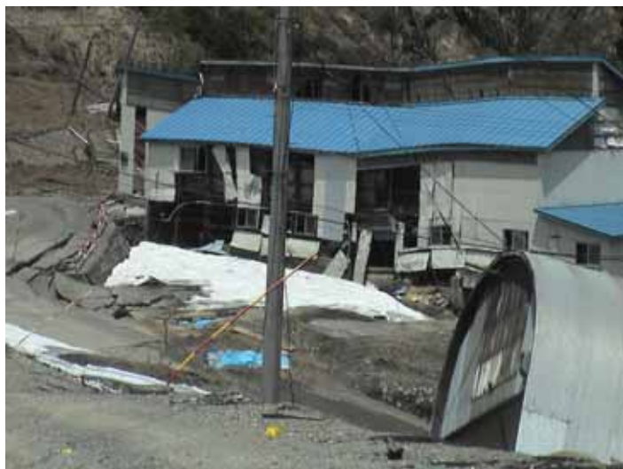
23-03池谷DSC00075.JPG 2005/05/14 11:02:35 谷部の盛土上の建物